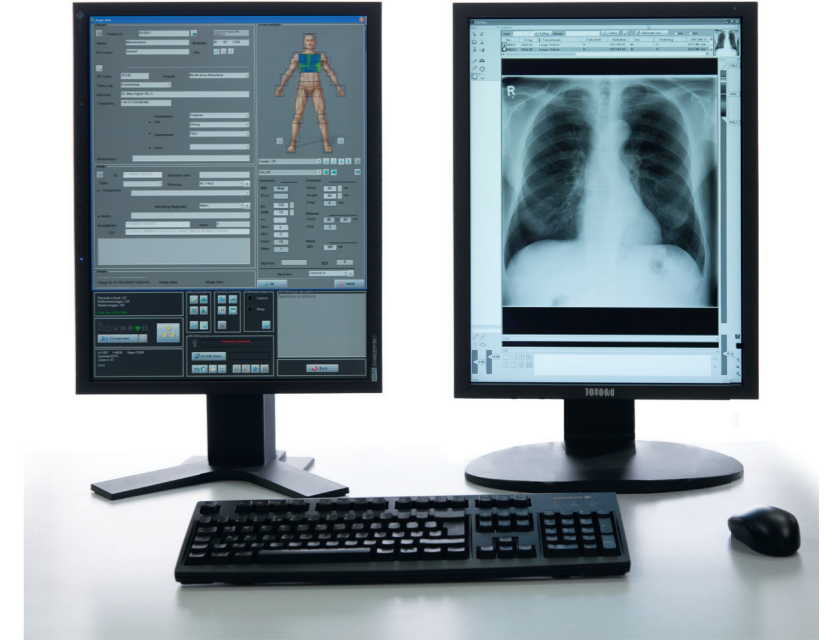
Renkli kullanıcı ve siyah beyaz sonuç monitörü