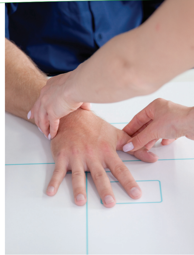
Doğrudan detektör üzerinde konumlandırma imkanı el röntgenleri vb